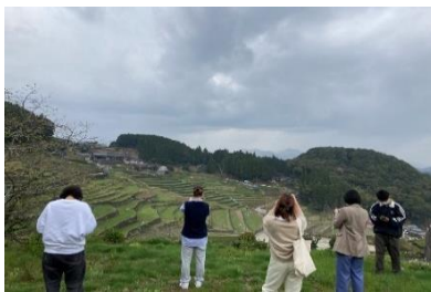
学生が収穫後の有効活用を思案している様子・2021年3月30