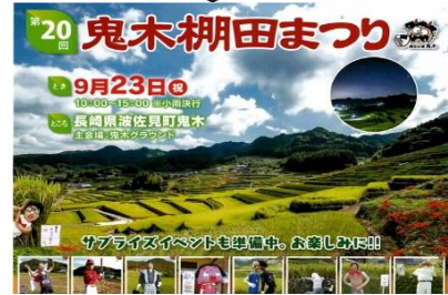
第20回鬼木棚田まつり（2019年9月23日開催）の案内ポスター