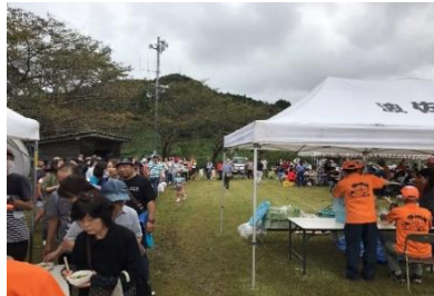
第20回鬼木棚田まつり・学生が運営スタッフで手伝っている様子