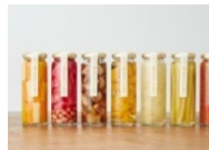
地域産品の加工・商品化

地場農林水産物を使った地域産品づくり 既存の直売所等と連携した販売促進、地域ブランドづくり 商品パッケージ等のデザイン検討 等