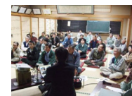
合意形成・計画づくり

住民意向調査、地域住民によるワークショップ開催 資源活用の推進体制・組織の整備、実施計画づくり 等