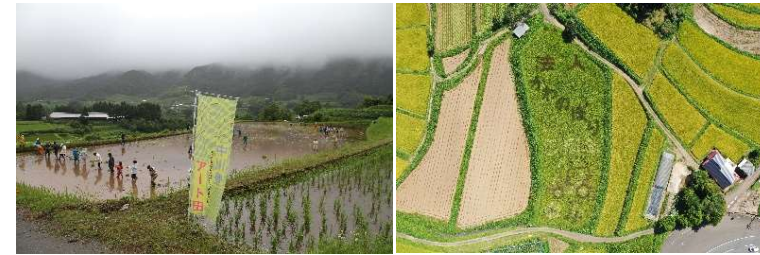
水田を活用した「田んぼアート」実施状況