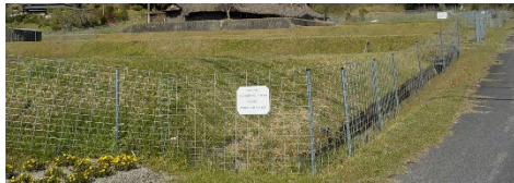
侵入防止柵の設置