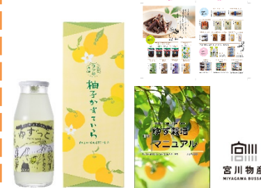
マーケットに合わせたデザイン