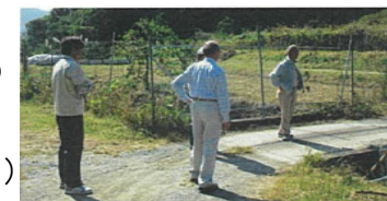
侵入防止柵の保守管理