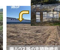
【荒廃農地の支障物撤去】