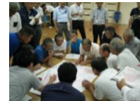
【地域ぐるみでの話し合い】

Step 1 地域ぐるみの話し合いにより、営農を続けて守るべき農地、粗放的な利用を行う農地等を区分し、実証的な取組を実施