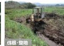
【粗放的利用のための条件整備】