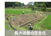
【農用地保全の実証的な取組】