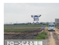
【省力化機械の導入】