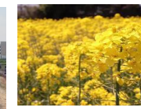
【蜜源作物等の作付け】