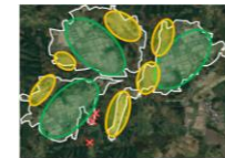
【土地利用構想の概定】