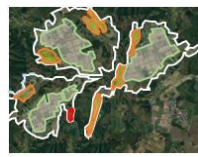
【土地利用構想の策定】

Step 2 土地利用構想を策定し、農用地保全のための条件整備や各種取組を選択・実施