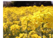
【蜜源作物等の作付け】