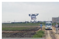
【省力化機械の導入】