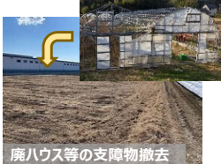
【荒廃農地の支障物撤去】