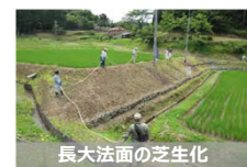
【農用地保全の実証的な取組】