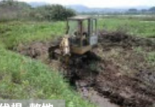
【粗放的利用のための条件整備】