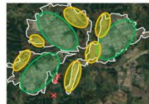
【土地利用構想の概定】