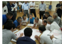
【地域ぐるみでの話し合い】

Step 1 地域ぐるみの話し合いにより、営農を続けて守るべき農地、粗放的な利用を行う農地等を区分し、実証的な取組を実施