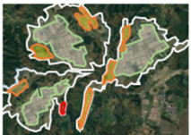
【土地利用構想の策定】

Step 2 土地利用構想を策定し、農用地保全のための条件整備や各種取組を選択・実施