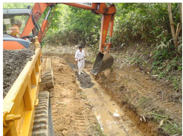
【用水路砂利敷き作業】