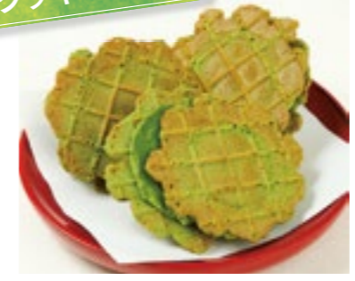
こいまるワッフルサンド

京都宇治田原町で昭和元年創業のお茶屋さんが作った、サクッと軽い食感のワッフル型クッキーサンド。石うすで挽いた宇治抹茶を生地にもクリームにも使用。8個入り・1,300円／株式会社宇治田原製茶場