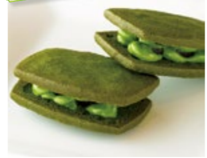
抹茶バターサンド

全国有数の抹茶産地、愛知県西尾市産の抹茶を石うすで挽いて使用。濃厚な抹茶クリームにかのこ豆を混ぜ込み、抹茶クッキー生地ですンドしている。1個・248円／株式会社あいや