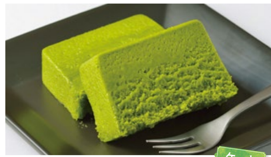
挽きたて抹茶の贅沢テリーヌ

京都宇治の菓子店が作る抹茶スイーツの最高峰。口に入れるとトロリと溶け、濃密な香りが広がる。老舗抹茶専門店用に少量しか生産されない抹茶を地元農家から特別に分けてもらい、抹茶のエスプレッソとでもいうべき深く豊かな味を実現。1本・4,205円／シエ・アガタ