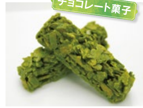
チョコレート菓子

宇治抹茶チョコクランチ・茶乃樹 サクサク、バリバリの食感が魅力。兵庫県の銘菓炭酸泉せんべいを砕き、宇治抹茶チョコでコーティング。一般的なクランチチョコとは一線を画す食感の良さを楽しめる。9個・1,296円／株式会社林屋久太郎商店