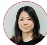
ユースギオン (京都精華大学マンガ学部 特任講師 /国際マンガ研究センター-研究員)