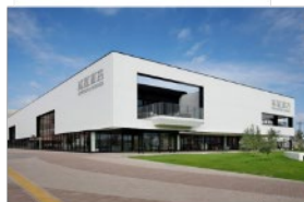
名古屋みなと 蔦屋書店