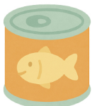
地元産品や料理の缶詰