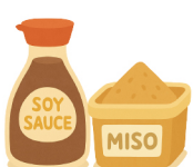
醤油・味噌、調味料