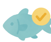
環境負荷を抑えた養殖魚 など

例：有機農産物、みえるらべる（生産者の環境負荷低減の取組を星の数で表したラベル）取得農産物など