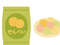
あられやせんべい など

例：外国人に向けたその地域ならではの食品、地方空港・免税店などで買える“地域発”食品など