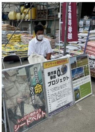
アンケート調査を実施する様子