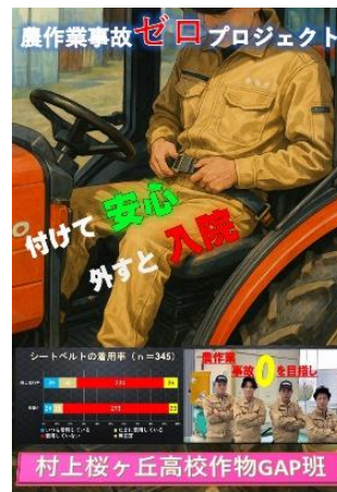
シートベルト着用促進・ 熱中症対策ポスター