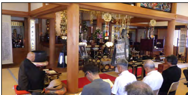
毎年開催される藩主祭の様子（2025年7月 専行院）