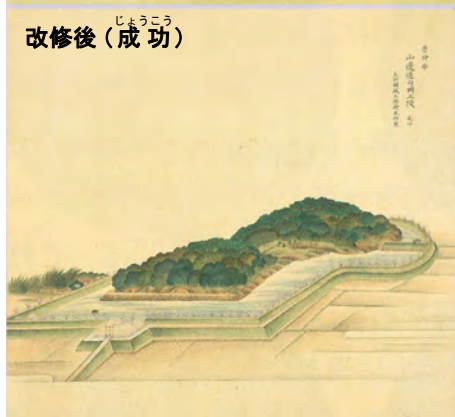
ぶんきゆうざんりょうず こうぶ じょうこう 文久山陵図（荒蕪・成功）