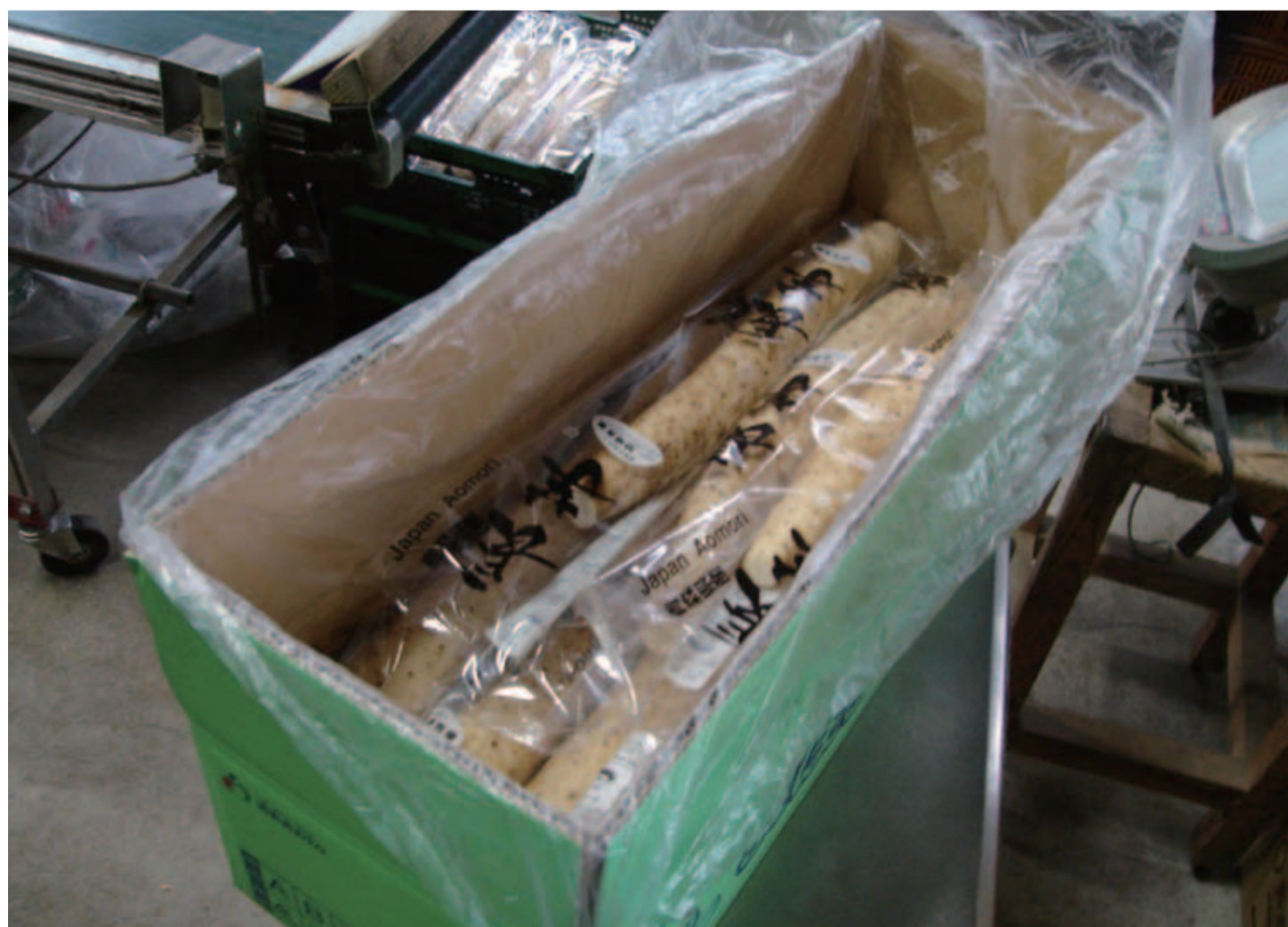
長芋の鮮度保持袋と箱詰め

長芋を、欧州ではスライスしてトリュフのように料理の上にかける食べ方や、米国では皮つきで BBQ の材料としての活用の提案を行っている。黒にんにくは、その機能性が大きく注目され海外の一流レストランでも採用されている。