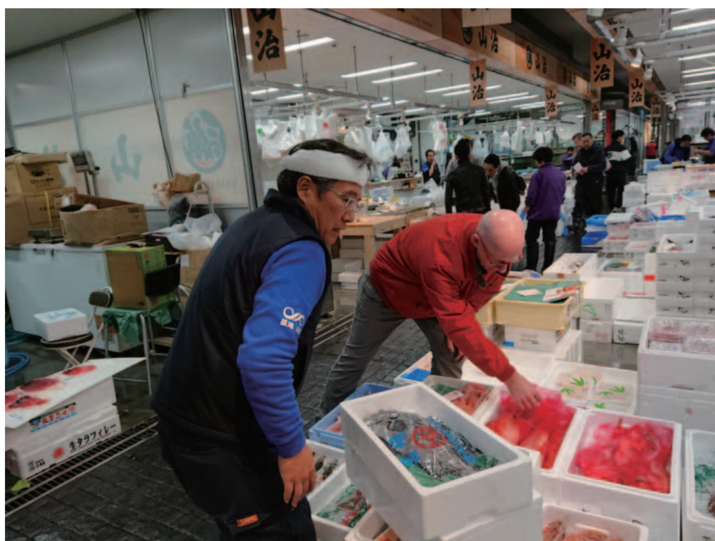
豊洲市場での商談

日本で最も水産物が集まる豊洲市場を最大限活用しており、自社で受注対応し、市場および産地から仕入れた鮮魚を豊洲市場内の冷蔵庫内のブースにて梱包し、羽田空港および成田空港から空輸で輸送している。 また、香港・台湾・米国向けには朝仕入れた魚の一部を真空フィレ加工することによって鮮度を維持する等、受注から仕入れ・加工・梱包・発送を自社で行い、リードタイムを短縮することにより高鮮度での輸出を実現している。