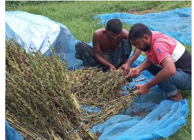
ゴマを収穫している様子