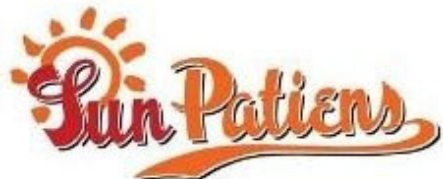
商標登録されているロゴマーク