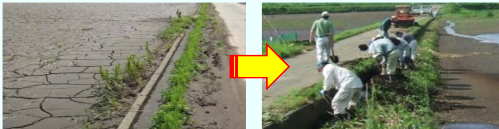
大雨により水路に堆積した土砂を地域共同で撤去（外注も可能）