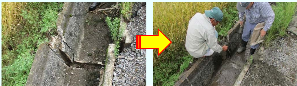
地震により破損した水路を地域共同で補修（外注も可能）