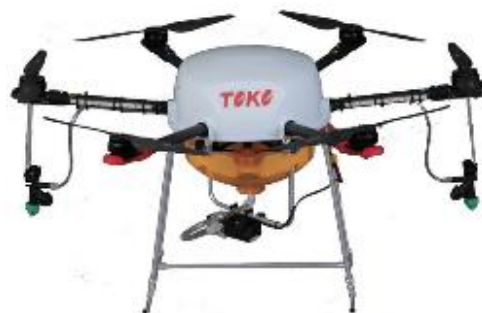
農薬散布用ドローン