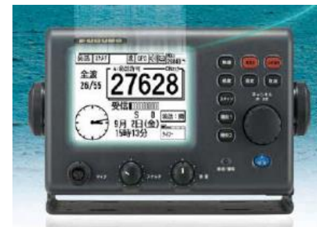
漁船用高機能無線機

漁場探索、漁獲に係る様々なデータを漁船・漁協関係者が瞬時に共有。漁獲方針の検討、報告等に係る接触機会を削減