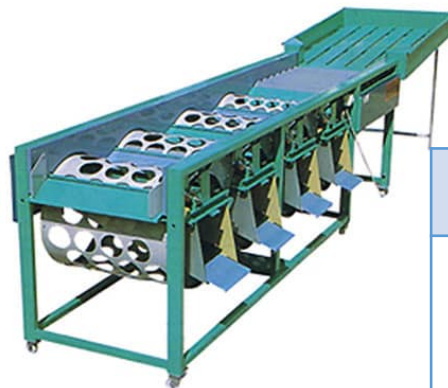
果実等自動選別機