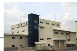
大規模共同乾燥調製施設