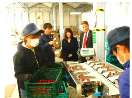
オランダ大使館参事官によるGAP農場視察 （平成30年2月18日あかい菜園（株））