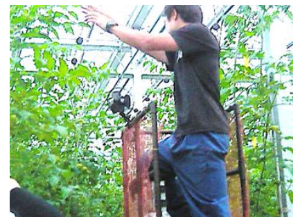
高所作業台車に取り付けた 落下防止ネットと扇風機