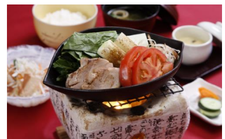
第4回 ホテル辰巳屋 料理コンテスト 和食部門最優秀作品 テーマ食材「サンシャイントマト」