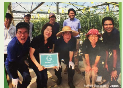
【リッチフィールド株式会社】