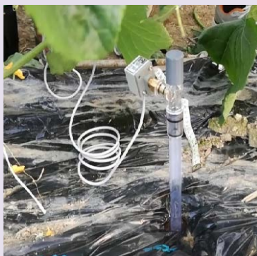
土壌水分モニタリングセンサー