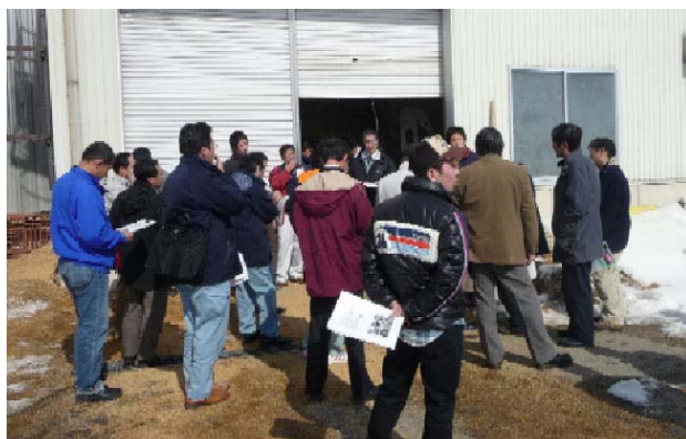
先進地事例調査の状況（H22）

地域振興局事業「由利牛肥育チャレンジプロジェクト」で農林部関係各課が連携して支援した。具体的には、JA部会、JA、市、県等からなる、プロジェクトチームを主体に、①肉用牛農家に対するアンケート調査による意向把握、②肥育マニュアル、啓発資料の作成、③先進地調査等により、