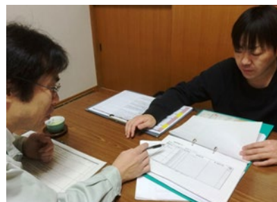
管理記録の確認・改善指導