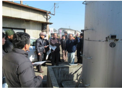
重油タンク・燃料小出槽の点検

(3) 新規にASIAGAPの取得を希望する農家に対し、GAP認証に必要な茶工場の整理や施設改修、燃料の取り扱いやリスク管理等のアドバイスを行った。(4回)