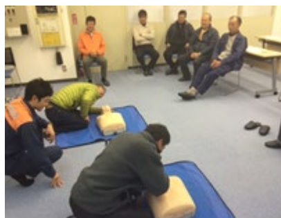
救急救命講習（労働安全）

2 入間くみあい製茶に対し、J G A P 団体認証の更新に向けた支援を行った。