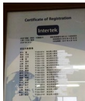
Certificate of Registration ( J G A P 認証証明書 )

(2) 団体による茶園の受託管理や作業受託について、受託条件の検討やオペレータの確保などの検討、助言を行った。