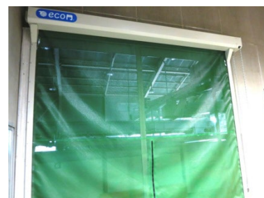
製茶工場出入口の改善