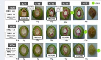
写真2 核色、硬核調査