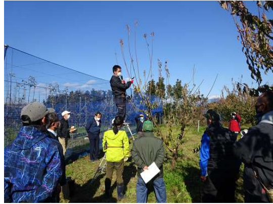
写真1 ウメ新品種「群馬U6号」の冬季管理講習会

令和2年までの3カ年で計画的な苗の生産配布を行い、苗木(計2,811本)を生産へ配布し結実対策を図った。また、農業技術センターと西部農業事務所と協力して、結実不良の園地2カ所で「群馬U6号」の導入による結実安定対策の現地試験をH30年度より取組を開始し導入効果を調査している。また、県園芸協会と協力して、ウメ冬季管理講習会を実施し、「群馬U6号」の剪定管理方法や受粉樹の特性等を県内生産者に周知し、適正管理による樹づくりを推進した。