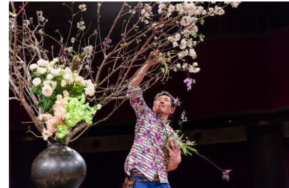
ジャパNFESTIVAL 「花いけバトル」