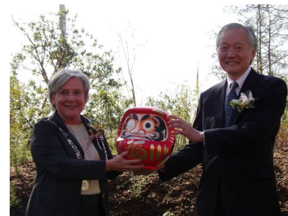
日本国出展開幕式 (だるまの目入れ：アルメーレ市長、堀之内大使)