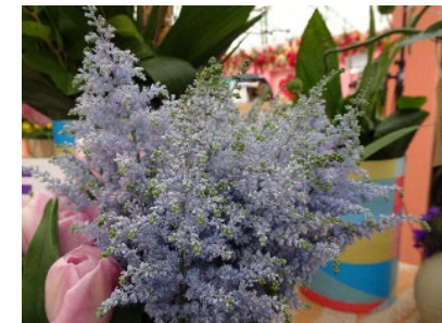
第三席（銅賞） JAながさき西海アスチルバ部会 アスチルベ（ライトブルー）