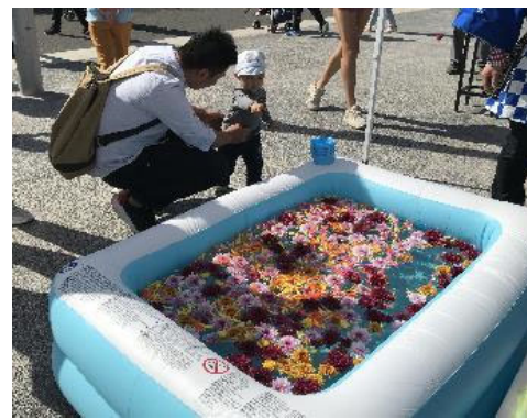
ジャパNFESTIVAL 「日本の縁日（お花すくい）」