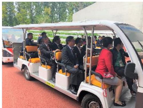
ジャパNDER 「会場ツアー」