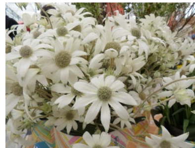
第二席（銀賞） 岐阜県 フランネルフラワー（ファンシーマリエ）