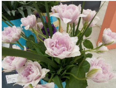
第一席（金賞） 富山県 チューリップ（乙女のドレス）