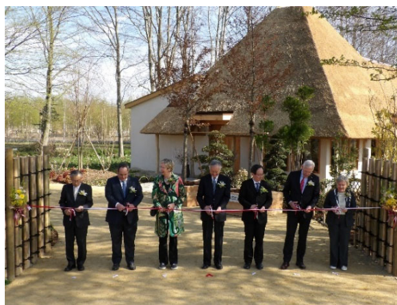
日本国出展開幕式 (テープカット)