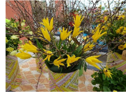
第三席（銅賞） 富山県 チューリップ（黄つるぎ）