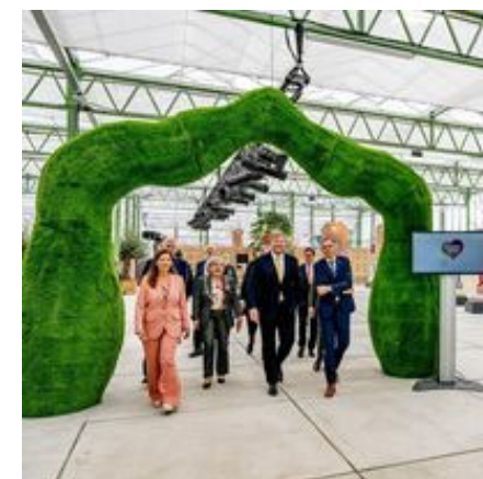
アルメーレ全体開会式 (アレクサンダー国王会場視察)