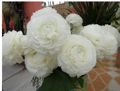
第一席（金賞） （株）フラワースピリット ランキュラス（綿帽子）