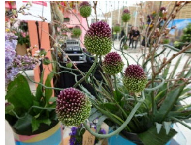
第二席（銀賞） JAグループくまもとアリウム部会 アリウム（踊る丹頂）