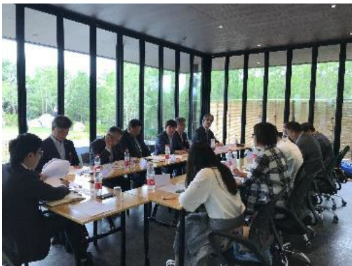
ジャパNDER 「ビジネス意見交換会」