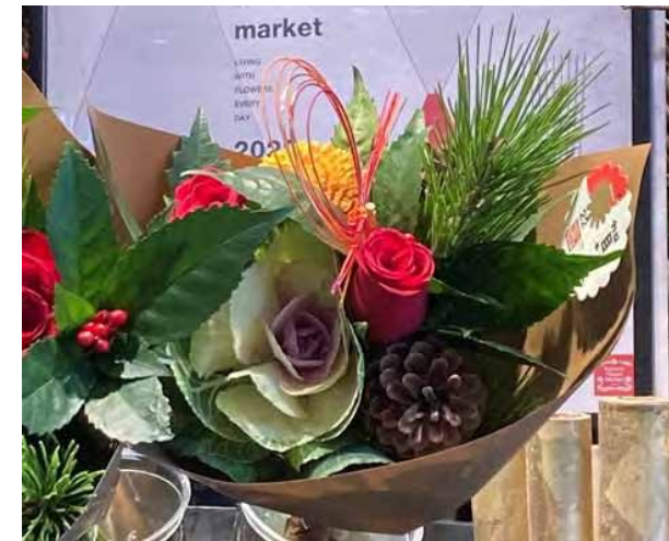
迎春アレンジメント

低温保管技術を核とし、品目に応じた適切な前処理剤/後処理剤/梱包補助資材の活用によって需要に応じた物日の計画・安定供給につながることを期待される。