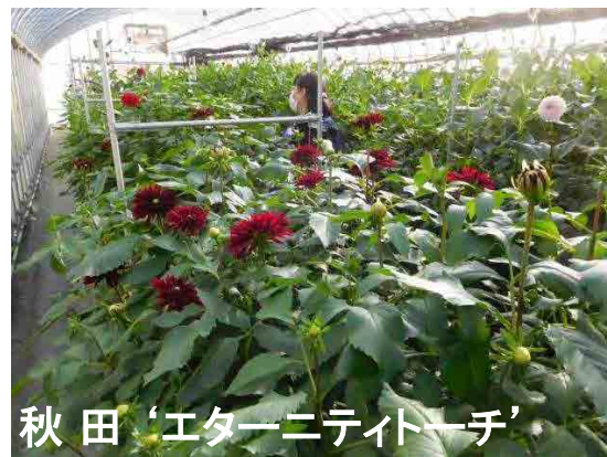
秋田 'エターニティトーチ'