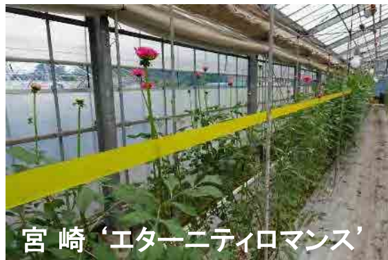
宮崎 'エターニティロマンス'