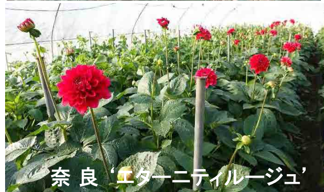
奈良 'エターニティルージュ'