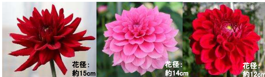
エターニティトーチ 花径：約15cm エターニティロマンス 花径：約14cm エターニティルージュ 花径：約12cm

主要花きの取扱金額が減少する中で、 ダリアは例外的に増加 ダリアは主要30品目中、 ここ10年で 最も伸び率が高い人気の切り花品目