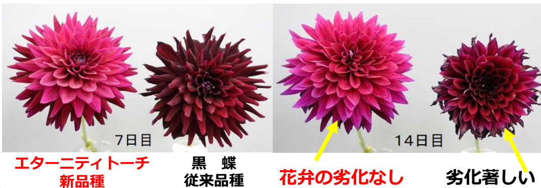
図 GLA液※における日持ち性の比較 ※GLA(グルコース、抗菌剤、硫酸アルミニウムからなる品質保持剤)を使用

良日持ち性品種を実需者へアピール → 全国への普及 ダリアの利用場面拡大 → ダリア全体のニーズ拡大