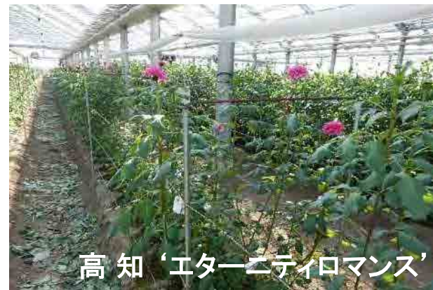
高知 'エターニティロマンス'