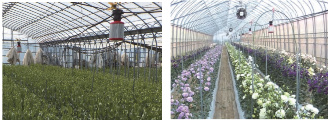
赤色LED電照の設置の様子