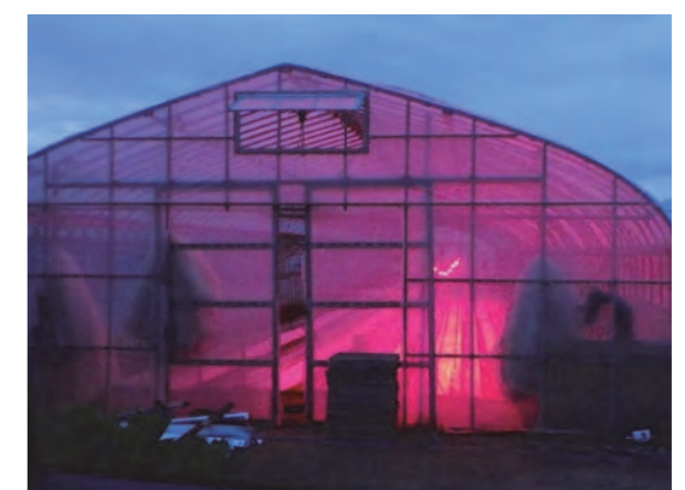
夜間に点灯する赤色LED電球