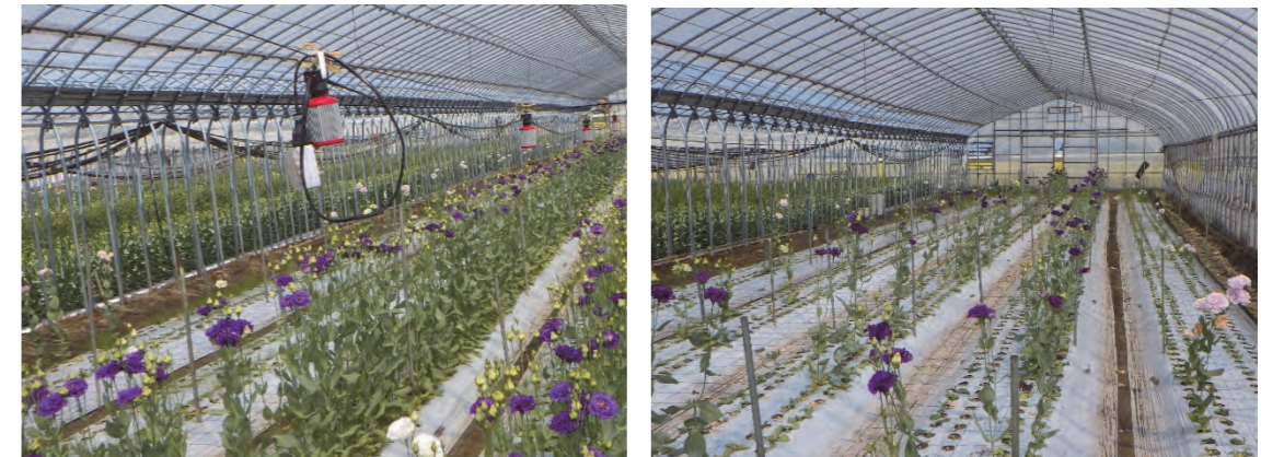
実証区(田舎館村、9/6撮影)