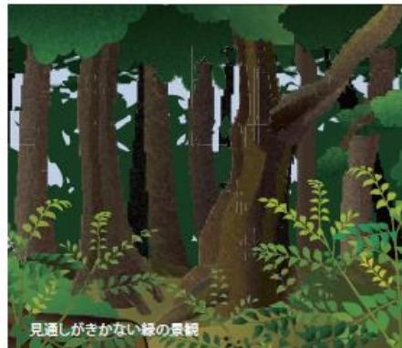
見通しがきかない緑の景観