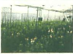
きりばなのはたけ (キンギョソウ)