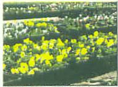
かだんなえのはたけ (パンジー)