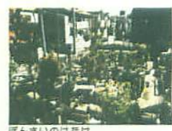
ぼんさいのはたけ