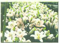
きりばなのはたけ (ユリ)