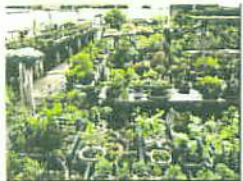
ぼんさいのはたけ