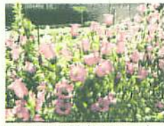
きりばなのはたけ (カンパニュラ)