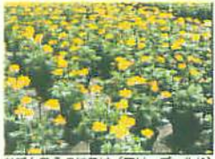
かだんなえのはたけ (マリーゴールド)