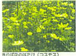
きりばなのはたけ (コスモス)