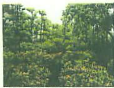
うえぎのはたけ (ツツジ)