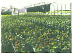
かだんなえのはたけ (ジニア)