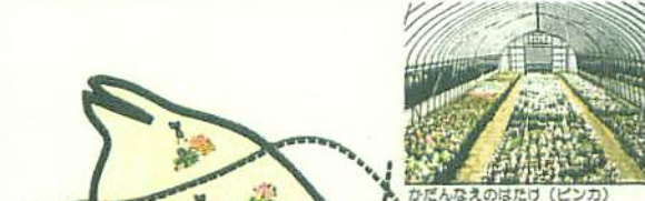
かだんなえのはたけ (ピンク)