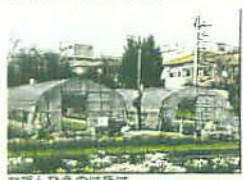
かだんなえのはたけ