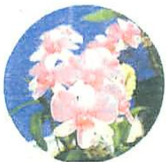
洋ラン(デンドロビウム)