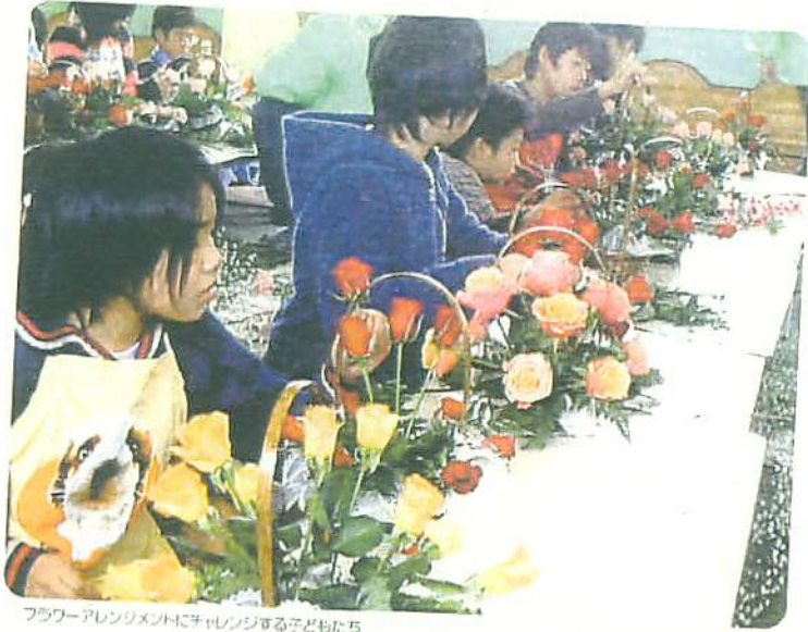
フラワーアレンジメントにチャレンジする子どもたち