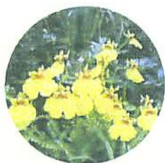
洋ラン(オンジジウム)