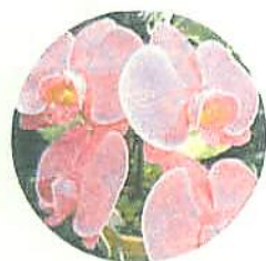
洋ラン(ファレノプシス)