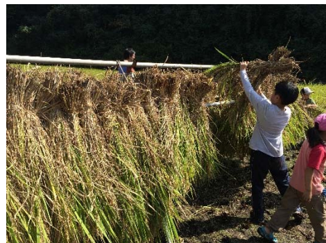
【収穫体験のイメージ】