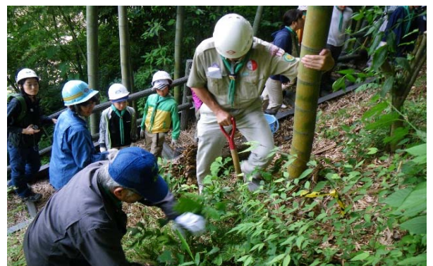
【植物管理や環境学習のイメージ】