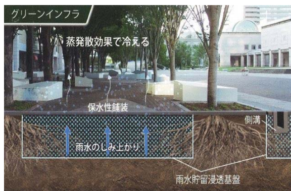
【グリーンインフラのイメージ（グランモール公園）】

博覧会の開催都市の横浜市には、2021年現在、公園や水辺、道路などを維持・管理する約4千団体もの地域のコミュニティが活動しており、街をみんなで良くしていこうとする素地がある。本博覧会ではこの素地を活かし、Villageにおける準備活動などを通じたコミュニティの再構築（テーマに関心を持つ市民の参加促進や新たなつながり）を図ることで、コミュニティの多様化・高度化を進め、博覧会のレガシーとして継承し、よりよい未来を創る主体（グリーンコミュニティ）を育てていく。