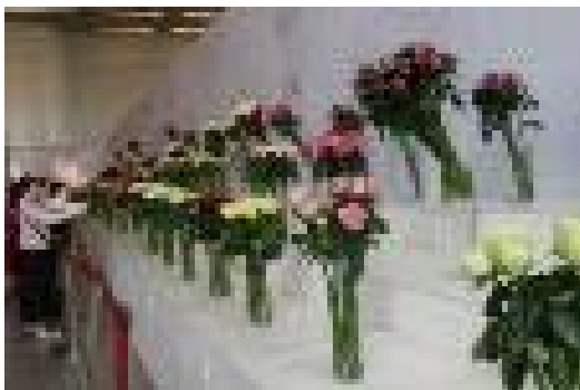
【コンペティションのイメージ】

上瀬谷地区の特徴であり、博覧会においても重要な要素である農について、公園内や周辺農地との連携による収穫体験や栽培研修など農と触れ合う場を提供することで、人々が自身の身近な生活に農を取り入れるファーミングを流行させるとともに、文化として根付かせることで、まちの中に農を浸透させる。また、農福連携の実践の場としてインクルーシブな社会の一翼を担う。