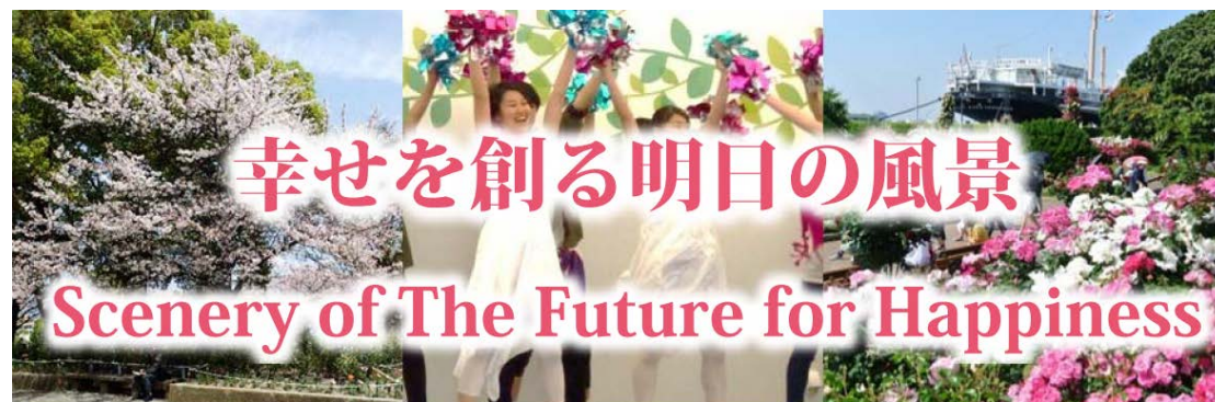
テーマの意図：日本・横浜が創る明日の豊かさを深める環境社会

「幸せを創る明日の風景」は、SDGsがもたらす豊かさを深める社会を、風景を通して具現化するものであり、花と緑を主題に先端技術も活用する園芸博覧会の特性を十分に発揮するものである。さらに、上瀬谷において、世界の国、企業、人々の参画による国際園芸博覧会を通して、平和で持続可能な人類の将来と日本の貢献を示すものであり、意義があると考えられる。