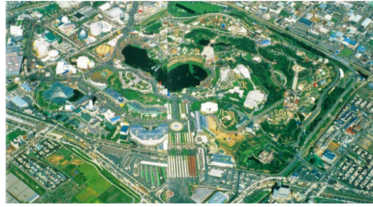
アジアで最初の国際園芸博覧会となった大阪花の万博（1990年）