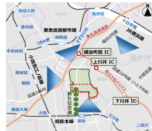
博覧会会場の想定区域