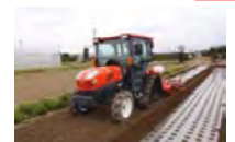
作柄安定技術の導入