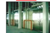
予冷库・貯蔵庫のリース