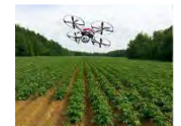
生育予測システム