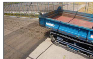
運搬車による土壌鎮圧

平成26年には、飛騨地域（吉城・高原地区）の半数以上の農業者が、土壌水分のリアルタイム測定による灌水管理に取り組みようになった。