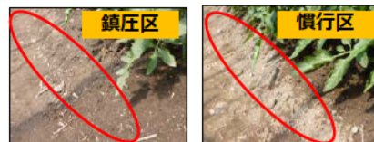
定植1か月後の様子

※2：pFメーターとは、植物が土の中の水分を吸い上げるのに必要な力を測る測定器。指示針の位置から土の水分状態を知り、灌水の時期・量を決める参考にする。