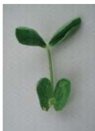
カップ状からさらに変形 =2