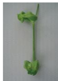
ひどく変形し原型をとどめない =3