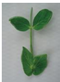
明らかにカップ状 =1