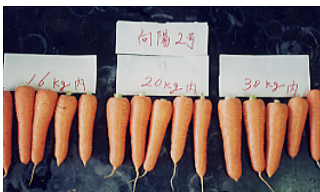
写真 1 窒素施肥量とニンジンの外観