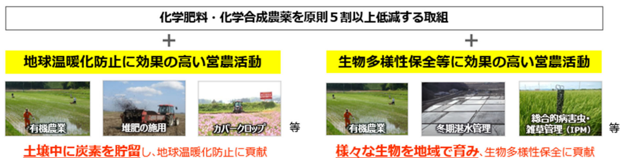
図1-3 本交付金の支援対象となる取組

有機農業に新たに取り組む農業者の受け入れ・定着に向けて栽培技術の指導等の活動を実施する農業者団体を支援。