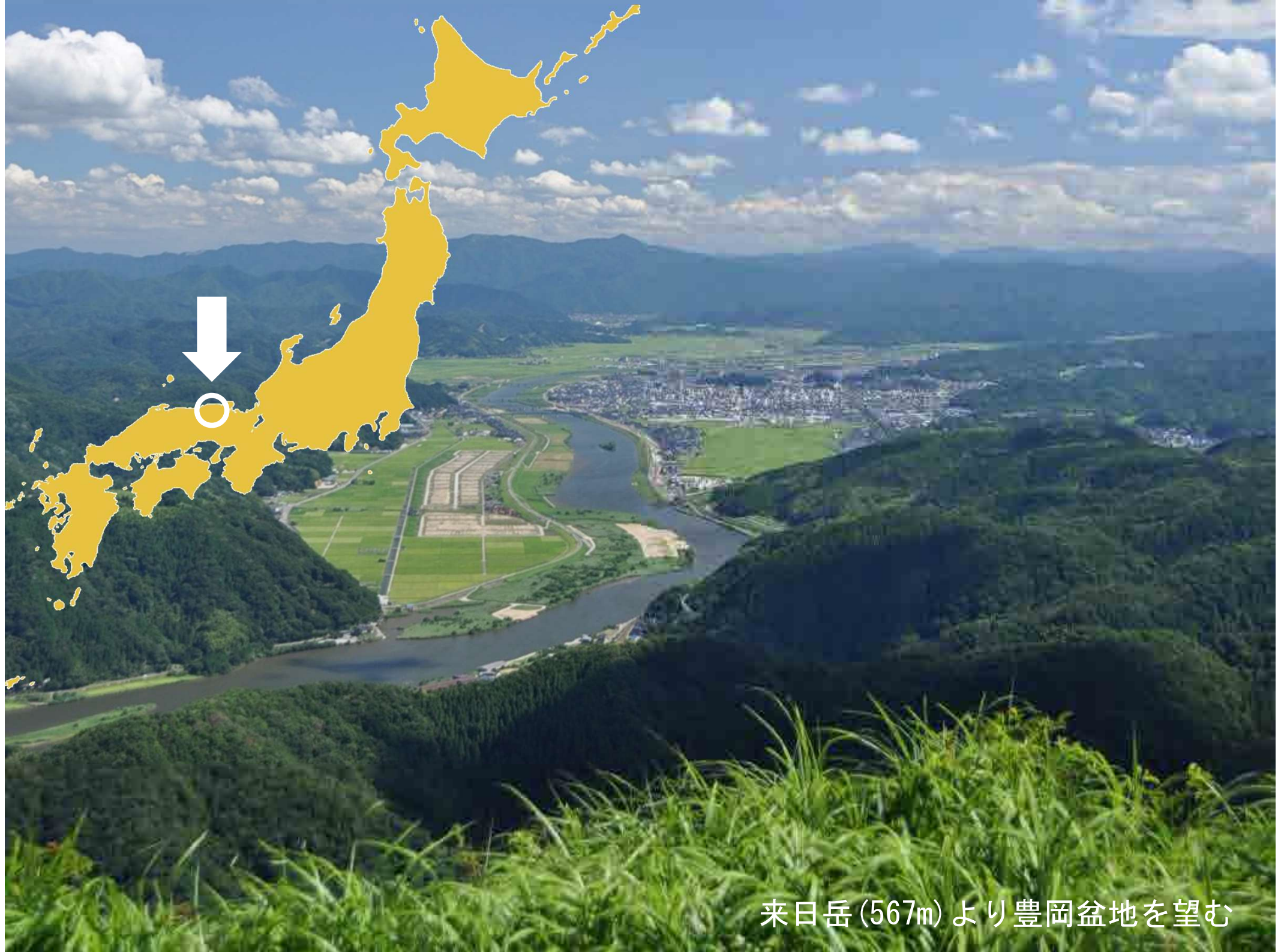
来日岳 (567m) より豊岡盆地を望む