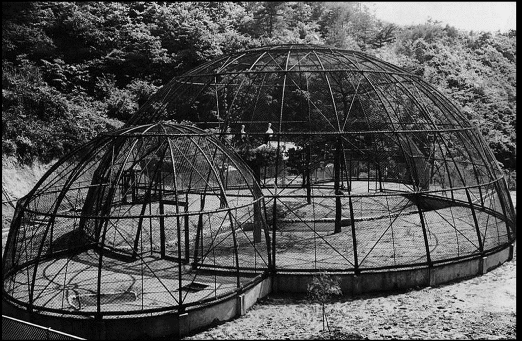
絶滅に先立つ1965年 人工飼育開始