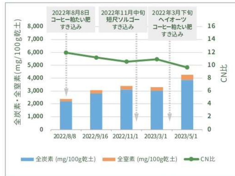
〈図〉全炭素・全窒素・CN比の推移 (Maruhanaファーム)