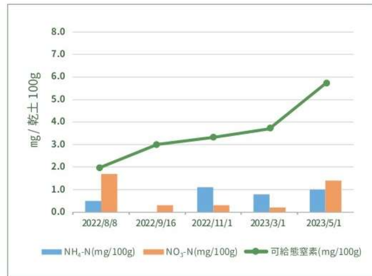
〈図〉各窒素の推移 (Maruhanaファーム)