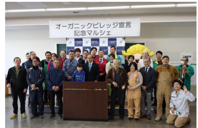
オーガニックビレッジ宣言の様子