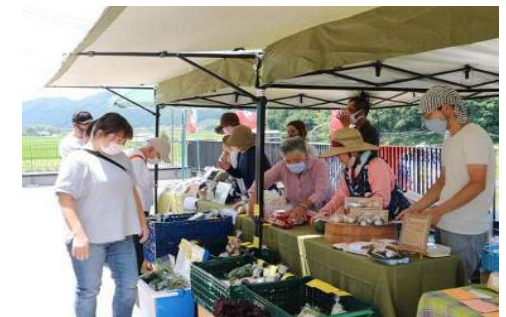
トヨタ丹波篠山店での有機野菜販売会