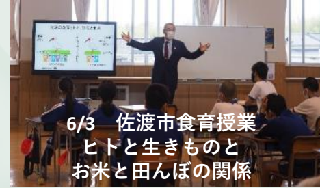
6/3 佐渡市食育授業 ヒトと生きものとお米と田んぼの関係