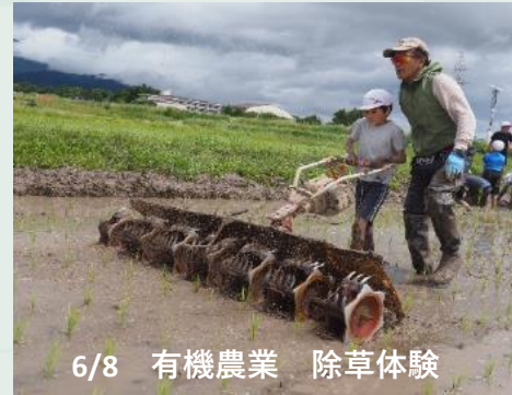
6/8 有機農業 除草体験