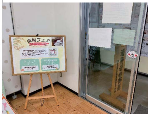
米粉のコラボメニューを提供しました。