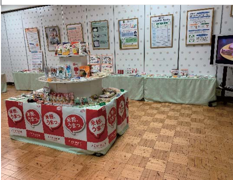
様々な米・米粉商品が並びました。