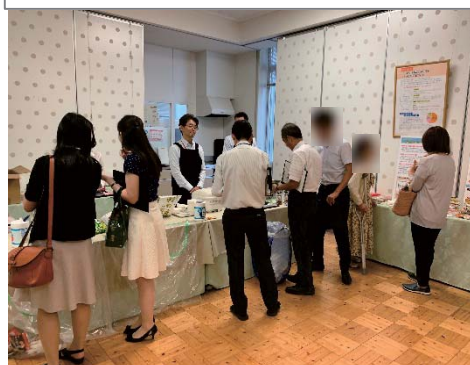
米粉製品の試食も行いました。