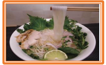
「ふくのこ」 の米粉麺

【育苗施設、補助対象施設・機械】 乾燥調製施設、種子生産関連施設とその付帯施設（表面参照）。 効率化の観点から、既存の建屋を活用して、関連機械を設置することも可能。