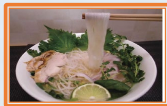
「ふくのこ」 の米粉麺