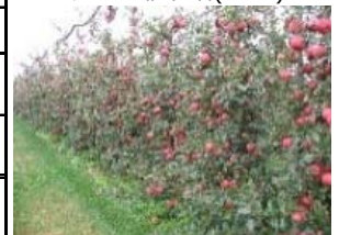
省力樹形の例 超高密植栽培(りんご)