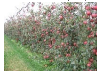
省力樹形の例 超高密植栽培(りんご)